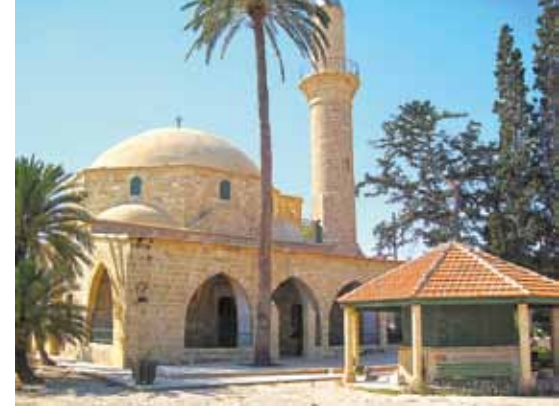
Hala Sultan Camii ve Tekkesi-Larnaka

Dünya hayatında temennilerimin bir numarasında sevgili Peygamberimizin yanında yer almayı hak edecek bir hayat sürebilmektir. Onun ahlakını örnek alan, merhametini kuşanan, adaletini hayatına yansıtan bir kul olabilmek. Bu ise kuru bir arzu ile değil, her gün yeniden verilen bir sözün uygulamaya dönüştürülmesiyle, pratiğe dökülmesiyle mümkün olabilir. Çünkü sevgili Peygamber’imize yakınlık , sözle değil; yaşamla, ahlakla ve insanlığa sunulan faydayla kazanılır.