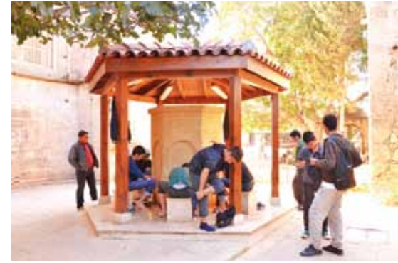
Yeniden aslına dönüş - Gazimağusa Lala Mustafa Paşa Camii