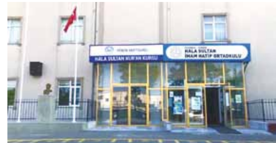
İstanbul-Pendik-Hala Sultan İmam Hatip Ortaokulu